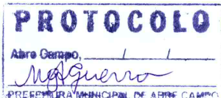
Márcio Moreira Víctor Prefeito Municipal